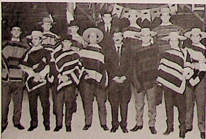
El Rector de la Universidad Mayor, Rubén Covarrubias G. y el Vicerrector, René Salamé M., junto a algunos de los alumnos que conforman el equipo de rodeo de esta casa de estudios superiores.

El V, se "corrió" alcanzado 13 puntos buenos; porque 108 jinetes, organizadores, alumnos, patrocinadores, colaboradores, 14.000 personas y muchos otros espectadores, lograron su objetivo: unirse, para mantener "vivo" en su sitio, nuestro deporte nacional.