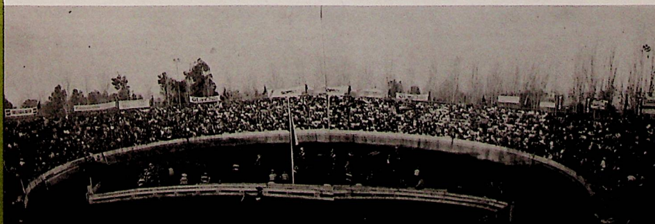
"Teniendo como escenario una medialuna colmada de 8 mil espectadores, se desarrolló el Champion de este V Rodeo Nacional".