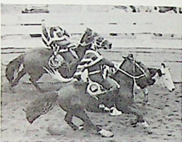
Una de las colleras, saliendo del apinadero.