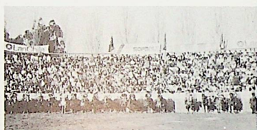
Los alumnos-jinetes, respetuosamente formados, escuchan el Himno Nacional.