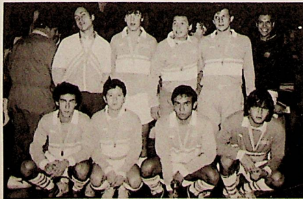
"Para el equipo de Fútbol Rápido de la Mayor, un importante 3er. lugar."