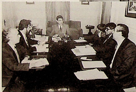
ESCUELA DE AGRONOMIA

En esta oportunidad, entregamos un avance de las principales acciones que se llevarán a efecto durante este segundo semestre, en el marco del mencionado Programa.