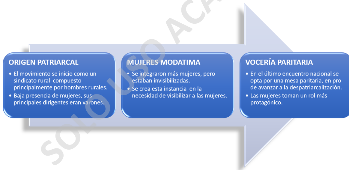
Figura 6.1-3 Transformación con perspectiva de género

...entonces en la medida que fue creciendo el movimiento, se fueron integrando muchas más mujeres, pero además de integrarse más mujeres, fueron tomando más rol de protagonismo mujeres donde ganó esa posición de despatriarcalizar el movimiento, porque también fue surgiendo el movimiento al calor del crecimiento del movimiento feminista a nivel nacional (T7, 17 de mayo de 2022).